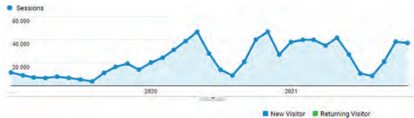
Figura 2. Gràfica d'evolució de sessions en la GEIEC (gener de 2019 - novembre de 2021)

Quant a nombre de sessions, hem passat d'unes 10.000 mensuals de gener a setembre de 2020 a vora 40.000 de gener a maig del 2021.